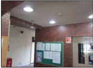
EV前エントランス デジタルレンズ一体型 逆光補正