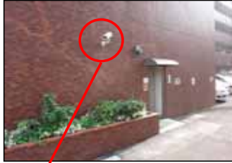
駐車場入り口 赤外線全天候型カメラ