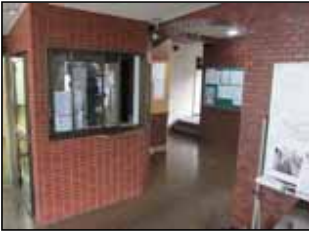
正面エントランス デジタルレンズ一体型 逆光補正