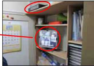
録画機がコンパクトなので スペースの有効活用が実現。 TRD-2408H H.264デジタルレコーダー