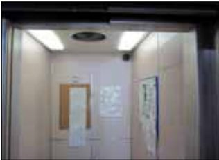
エレベーターかご内 小型広角レンズ搭載カメラ