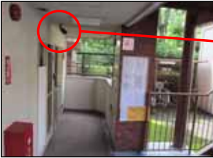
非常階段1F 赤外線全天候型カメラ