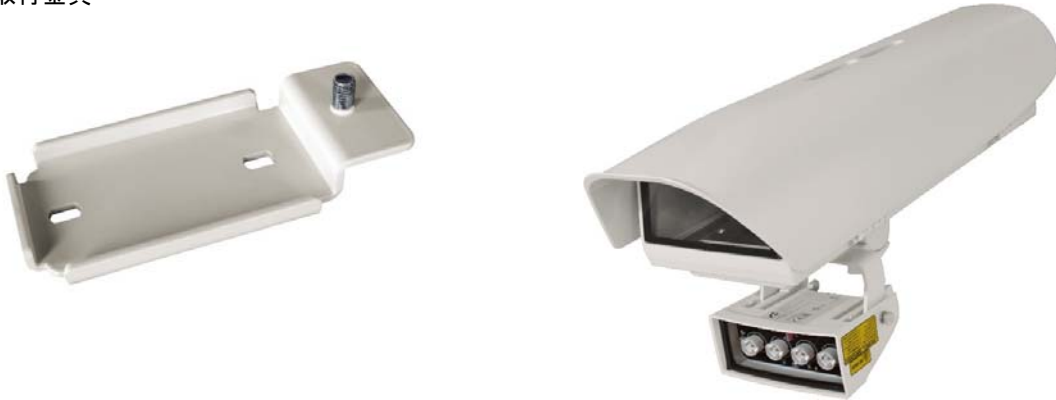
THS-V300へのライト取付例