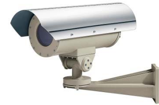
TS-EXHS-C36P TS-EXHS-C36VP TS-EXHS-H20VP TS-EXHS-H30P